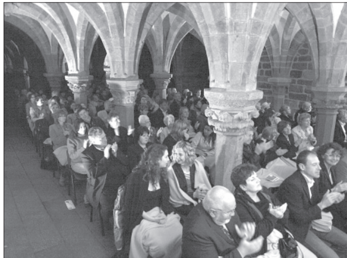
Prostor mezi sloupy byl zcela zaplněn.